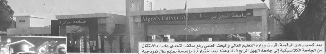
بعد كسب رهان الرقمنة، قررت وزارة التعليم العالي والبحث العلمي رفع سقف التحدي عالياً، بالانتقال من الجامعة الكلاسيكية إلى جامعة الجيل الرابع 4.0. وهذا، بعد اختيار 23 مؤسسة تعليم عالٍ نموذجية لبدء هذا المسار خلال الموسم الجامعي المقبل.